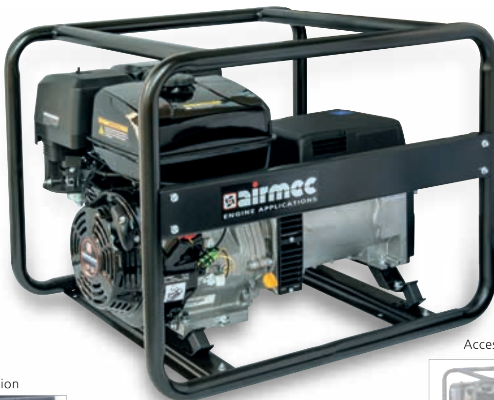
Accessorio - Accessory